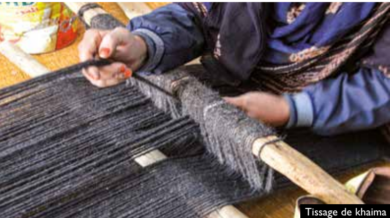
Tissage de khaima