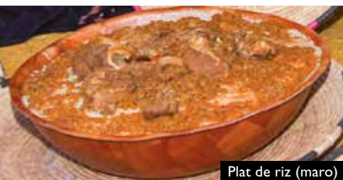
Plat de riz (maro)

La viande cameline est très prisée. Elle est cuisinée en tajine, en viande hachée (kefta) ou grillée en brochette. Son goût est très fin, et elle est particulièrement maigre idéale pour les amateurs de grillades légères. La viande ovine est elle aussi très prisée, le mouton cuit en méchoui figure parmi les fins mets de la province.