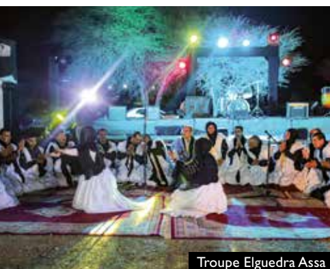
Troupe Elguedra Assa