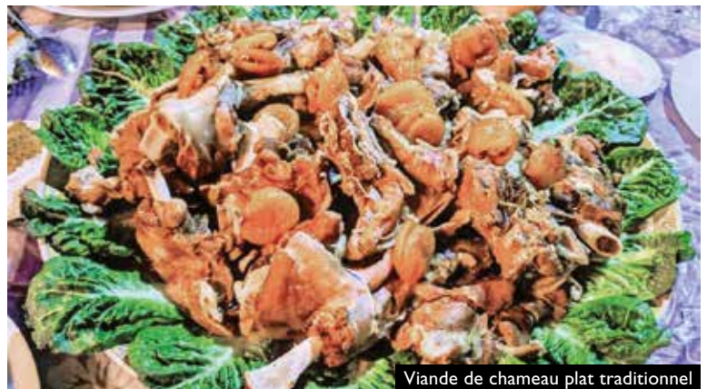
Viande de chameau plat traditionnel

La gastronomie est à l'image des paysages sublimes de la province, originale et basée sur des ingrédients naturels. La cuisine locale a su conserver une rusticité et une grande originalité, fidèle à ses spécificités et à la nature qui l'entoure.