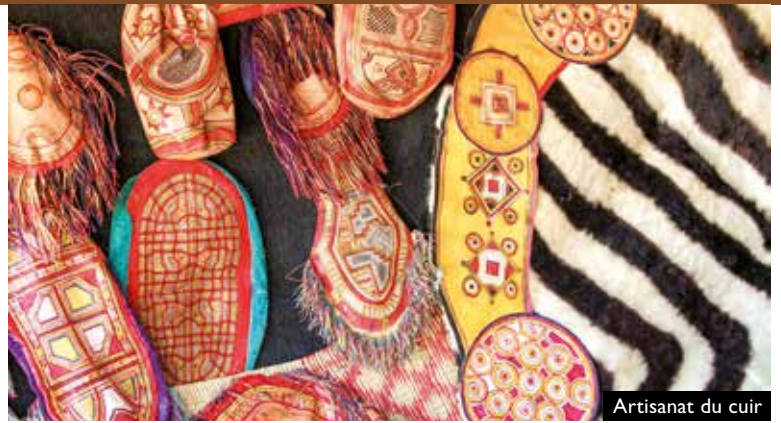
Artisanat du cuir