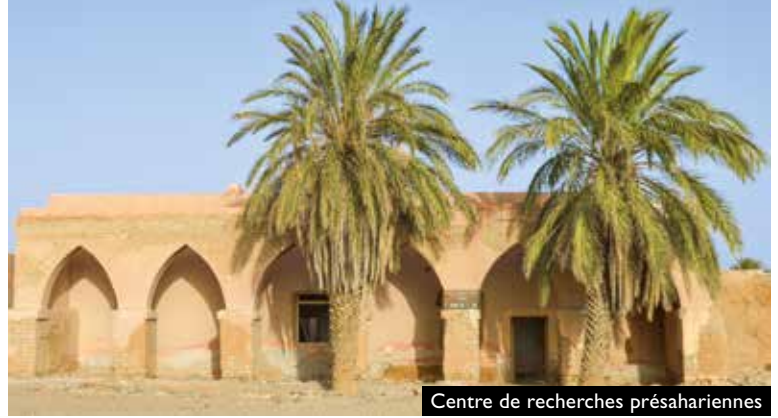
Centre de recherches présahariennes