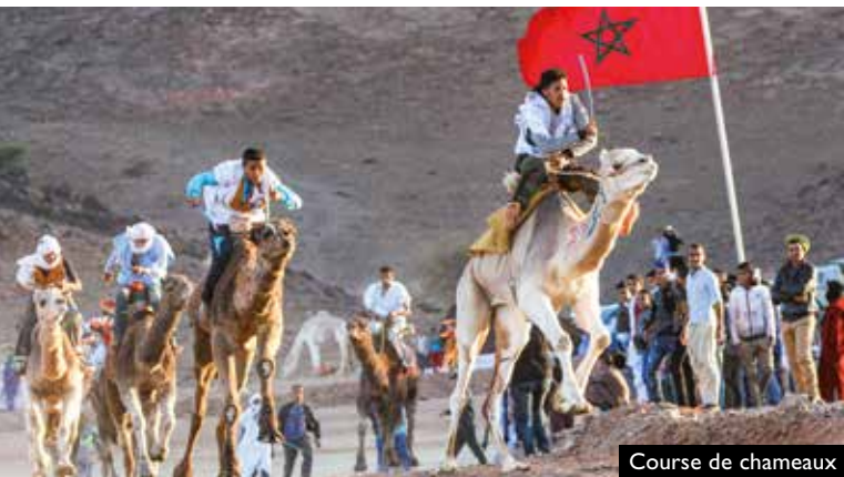
Course de chameaux