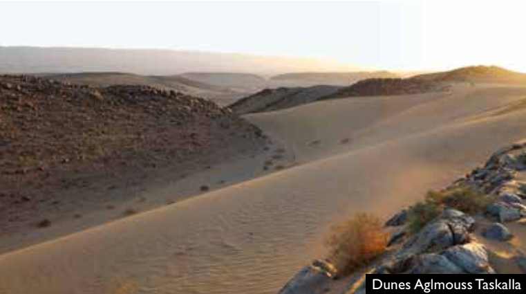
Dunes Aglmouss Taskalla