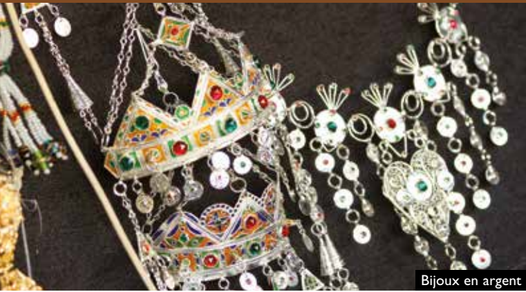
Bijoux en argent