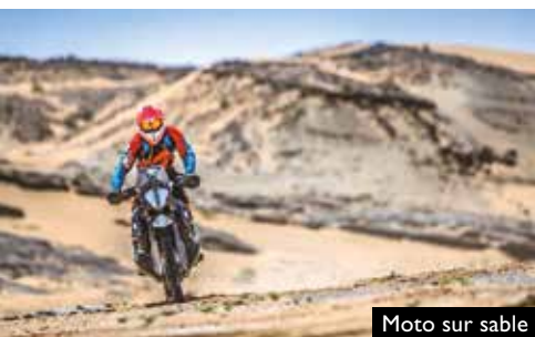
Moto sur sable

Lors de cette manifestation artistique organisée chaque année, plus de 100 tentes thématiques sont organisées en espace d'exposition. Ces tentes, qui s'ouvrent aux pays d'Afrique de l'Ouest, sont l'occasion de découvrir les traditions et les coutumes des tribus nomades les plus importantes de chaque pays, leurs arts, leur culture, leur patrimoine et les similarités avec la culture nomade au Sahara marocain.