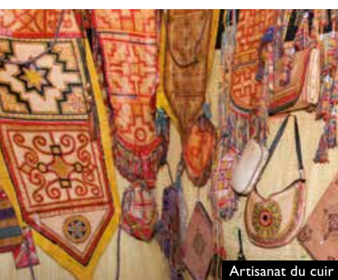
Artisanat du cuir

La laine est utilisée pour le tissage des tapis et, de plus en plus rarement, pour la fabrication des tentes (khyama), un des éléments indispensables de la vie des nomades de la zone.