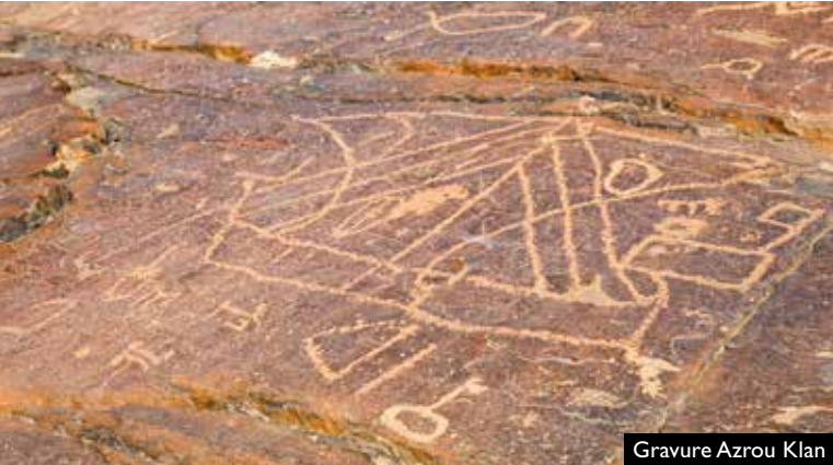
Gravure Azrou Klan