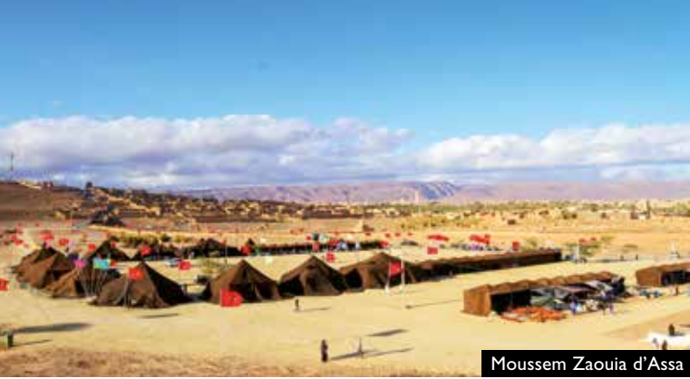
Moussem Zaouia d'Assa