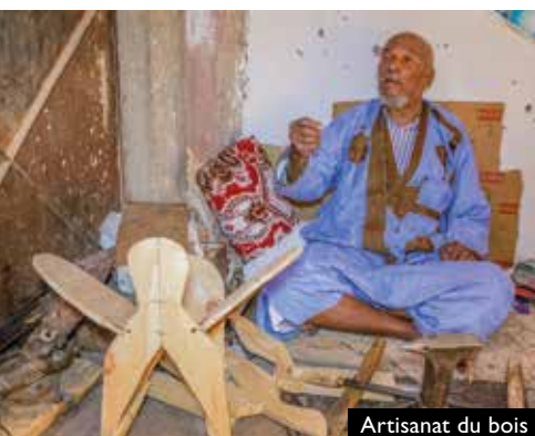
Artisanat du bois