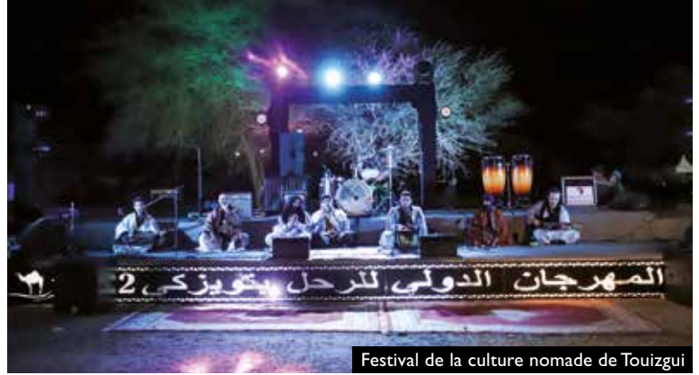
Festival de la culture nomade de Touizgui