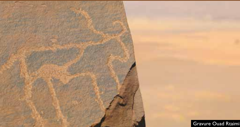
Gravure Ouad Rtaimi

A dos de dromadaires ou de véhicules ou même à pied, les possibilités sont variées, y compris bivouaquer en pleine nature.